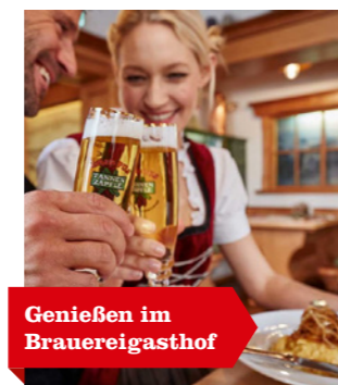
Genießen im Brauereigasthof

Eine interaktive Ausstellung lässt euch in die Geschichte unserer Brauerei sowie die Verbindung von traditioneller Braukunst mit innovativen Produktionsmethoden eintauchen. Mit einem Audioguide (an der Information erhältlich - DE, EN, FR), ist die ZÄPFLE Heimat auf eigene Faust zu besichtigen.