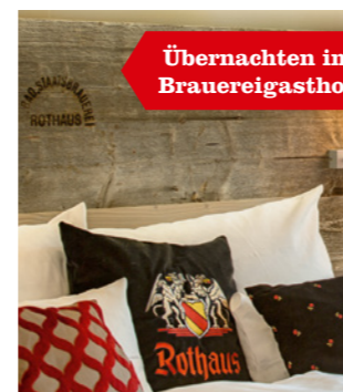
Übernachten im Brauereigasthof

Als Naturparkwirt bieten wir unseren Gästen das ganze Jahr hindurch saisonale und regionale Speisen an. „Regional“ bedeutet, dass die Hauptzutaten direkt aus dem Naturpark Südschwarzwald stammen. Dies ist ein Garant für die Frische und hohe Qualität unserer Gerichte.